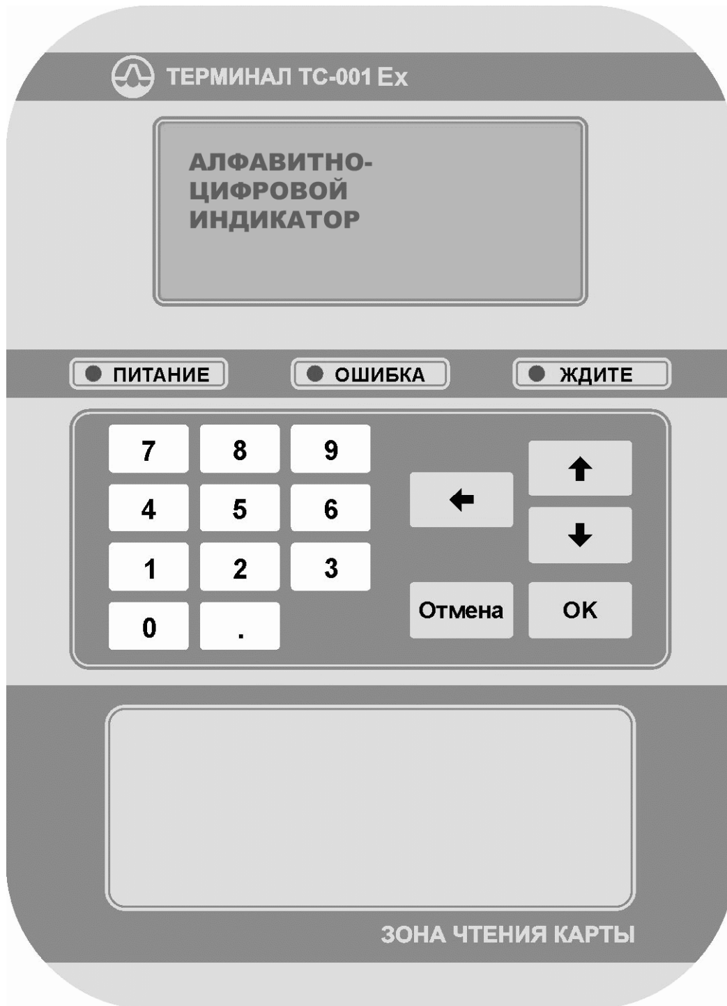
Рисунок 1 - Лицевая панель терминала ТС-001Ех

1.2.1.4 Прибор имеет звуковую сигнализацию ввода информации с клавиатуры. При нажатии на кнопку прибор издает короткий звуковой сигнал, если нажатие принято. При обнаружении ошибочного нажатия на кнопку прибор издает длинный звуковой сигнал.